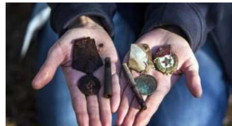
Артефакты, найденные в могиле солдата, погибшего в Тверской области в 1942 г. 2016 г.