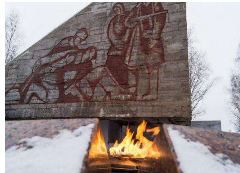
Мемориал «Славы» в Старой Руссе. Новгородская обл. Открыт в 1964 г.