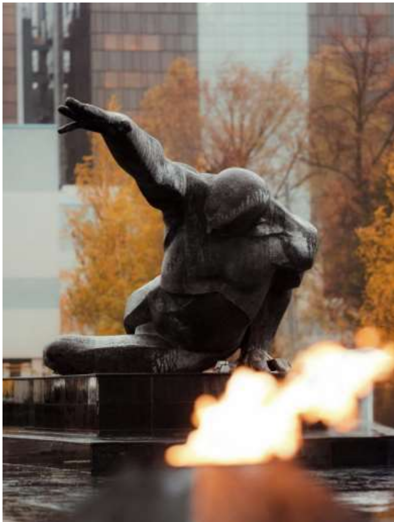
Памятник «Неизвестному солдату». Казань. Открыт в 1967г.