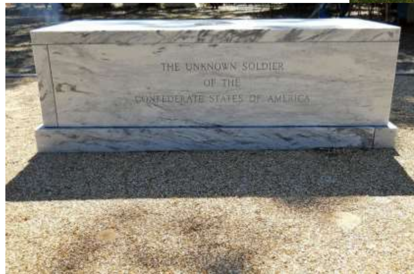
Бовуар, штат Миссисипи, США

В Западном полушарии первый памятник Неизвестному солдату был установлен в США после окончания войны Севера и Юга 1861–1865 годов в штате Миссисипи.