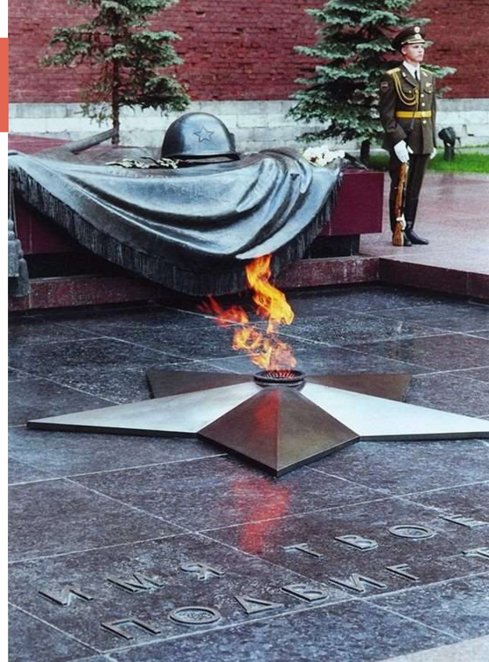
Могила Неизвестного солдата, Москва

«Имя твоё неизвестно, подвиг твой бессмертен»