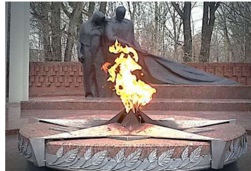
Мемориал «Вечный огонь». Тюмень. Открыт в 1968 г.