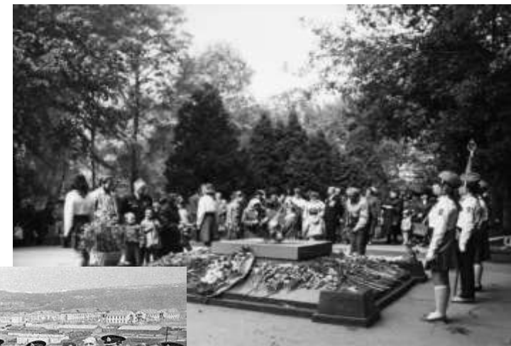
Вечный огонь у военного мемориала на Преображенском кладбище, Москва.