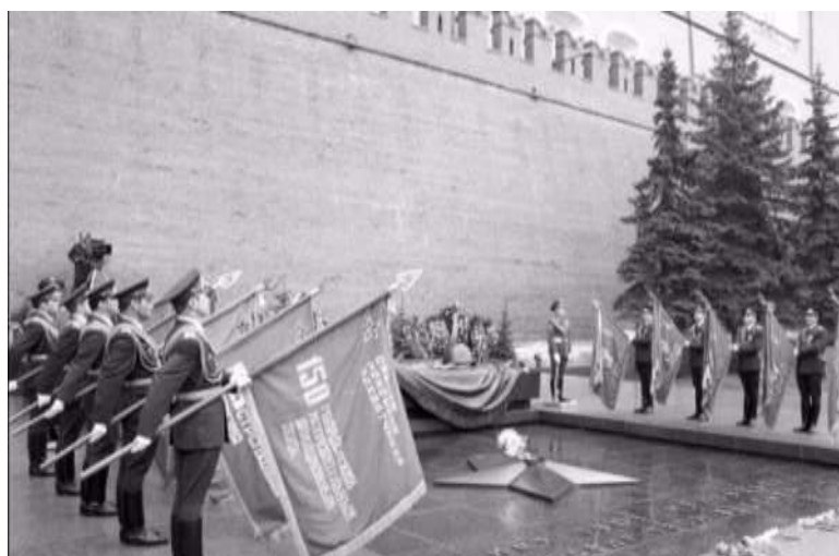
Торжественное открытие мемориала Неизвестному солдату, 8 мая 1967 г.