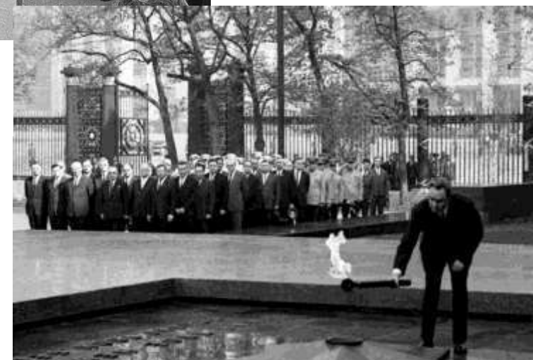
Церемония зажжения Вечного огня у Могилы Неизвестного солдата. Москва.