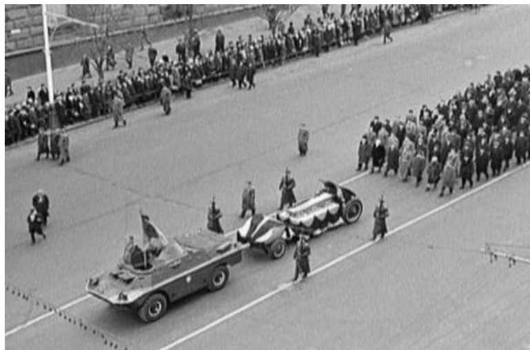
Траурная процессия на Тверской ул. Москвы. 3 декабря 1966 г.

8 мая 1967 года состоялось торжественное открытие мемориала.