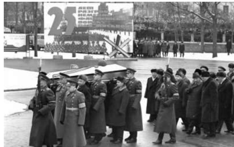
Захоронение у Кремлёвской стены останков Неизвестного солдата. 3 декабря 1966 г.