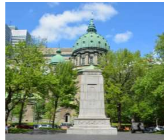
Кенотаф. Монреаль, Канада