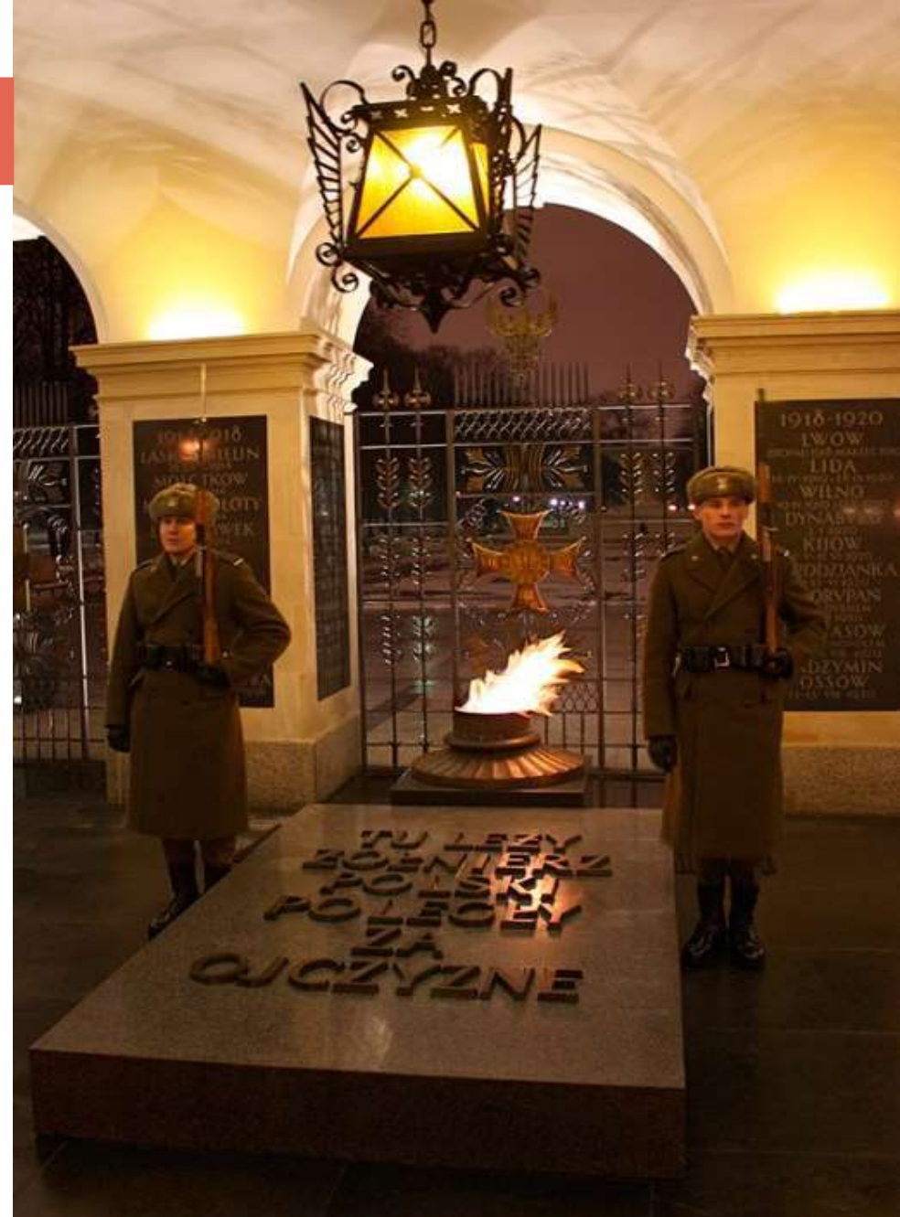
Могила Неизвестного солдата. Варшава, Польша

Он стал источником пламени для большинства воинских мемориалов , открытых в городах-героях, а также городах воинской славы.