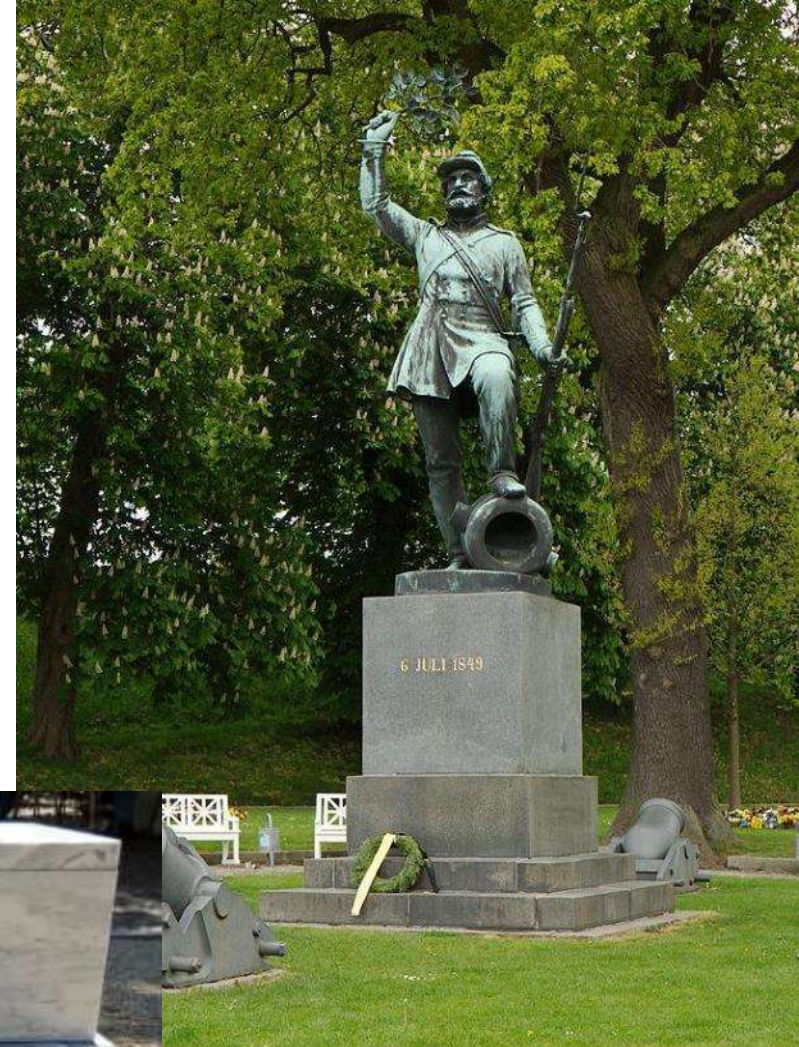
«Неизвестный пехотинец», Фредоричия, Дания