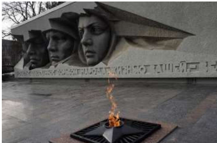
Мемориал «Вечная слава». Ставрополь. Открыт в 1967г.