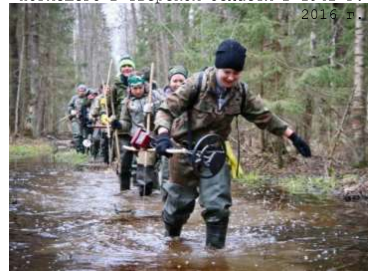
Экспедиции Поискового движения России