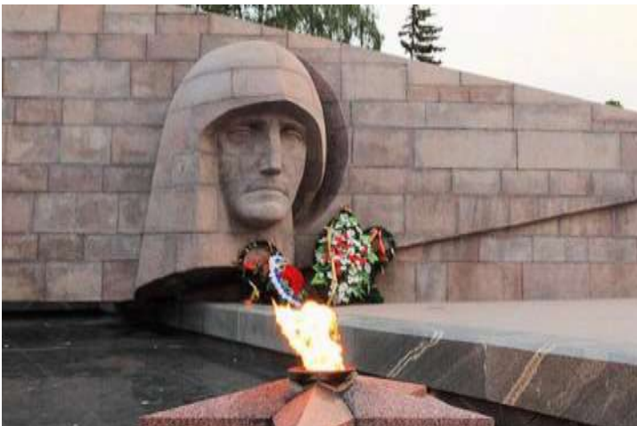
Памятник "Скорбящей матери-Родине". Самара. Открыт в 1971 г.