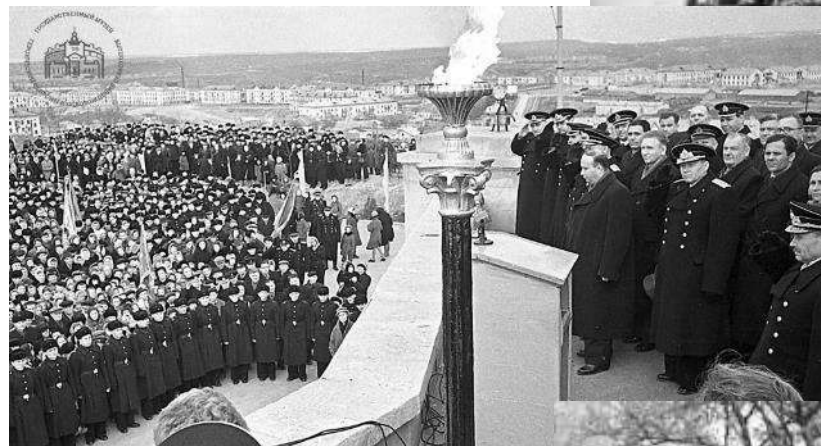
Зажжение вечного огня на Малаховом кургане. Севастополь. 1958 г.

Факел с огнем был доставлен из Ленинграда по эстафете всего за один день. У Манежной площади ценный груз принял знаменитый летчик Герой Советского Союза Алексей Маресьев.