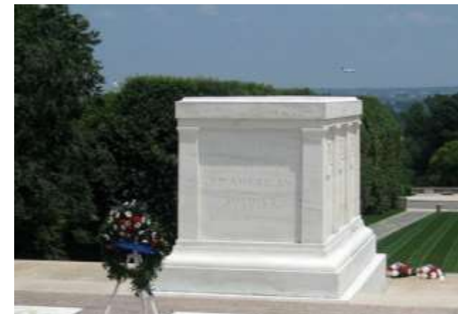
Штат Вирджиния, США